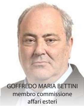
GOFFREDO MARIA BETTINI membro commissione affari esteri