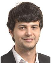
BRANDO BENIFEI membro commissione occupazione e affari sociali brando.benifei@europarl.europa.eu

LE MISURE DI AUSTERITÀ ADOTTATE NEL CONTESTO DELLA CRISI ECONOMICA HANNO AVUTO RIPERCUSSIONI NEGATIVE SOPRATTUTTO SUI GIOVANI, CHE SONO STATI I PIÙ ESPOSTI ALLA DRASTICA RIDUZIONE DI INVESTIMENTI NELL'ISTRUZIONE E NELLA CULTURA, ALLA DISOCCUPAZIONE E AI TAGLI AI SERVIZI SOCIALI.