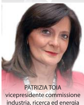
PATRIZIA TOIA vicepresidente commissione industria, ricerca ed energia