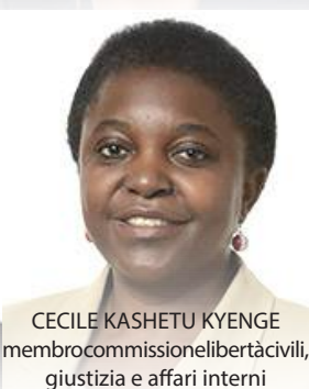
CECILE KASHETU KYENGE membro commissione libertà civili, giustizia e affari interni