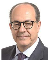
PAOLO DE CASTRO vicepresidente commissione agricoltura e sviluppo rurale paolo.decastro@europarl. europa.eu

GLI EURODEPUTATI HANNO RIBADITO, ANCHE A STRASBURGO, CHE TUTTI VOGLIONO MAGGIORE FLESSIBILITÀ, MA CHE NON HANNO INTENZIONE DI PAGARLA CON UNA VERA E PROPRIA RI-NAZIONALIZZAZIONE DEI COSÌ DETTI DELIVERY MODELS. IL PERICOLO INVECE È TANGIBILE, SOPRATTUTTO PER TUTTI QUEI PAESI, COME GERMANIA, ITALIA, SPAGNA E FRANCIA IL CUI SISTEMA COSTITUZIONALE SI FONDA SU BASE FEDERALE O REGIONALE DEFERENDO A LIVELLO LOCALE LA REALIZZAZIONE DEI PIANI STRATEGICI NAZIONALI.