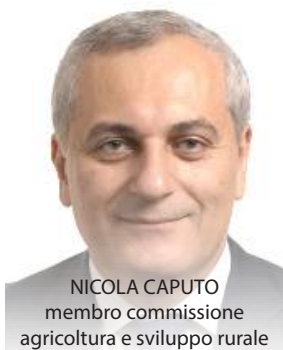
NICOLA CAPUTO membro commissione agricoltura e sviluppo rurale