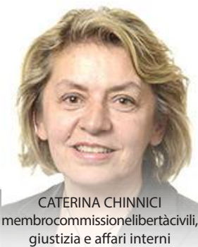
CATERINA CHINNICI membro commissione libertà civili, giustizia e affari interni