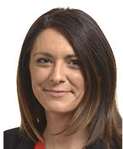
PINA PICIERNO membro commissione bilanci giuseppina.picierno@europarl.europa.eu

COME PARLAMENTO EUROPEO ABBIAMO CHIESTO CON FORZA CHE CI SIA UN MIGLIORAMENTO NELL'APPLICAZIONE UNIFORME DELLA DIRETTIVA 2012/29/UE, CHE ISTITUISCE NORME MINIME IN MATERIA DI DIRITTI, ASSISTENZA E PROTEZIONE DELLE VITTIME DI REATO NEGLI STATI MEMBRI DELL'UE.