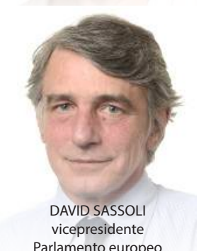
DAVID SASSOLI vicepresidente Parlamento europeo