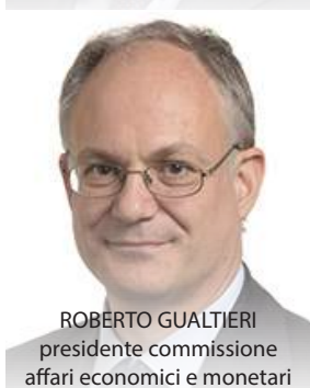
ROBERTO GUALTIERI presidente commissione affari economici e monetari