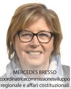
MERCEDES BRESSO coordinatrice commissione sviluppo regionale e affari costituzionali