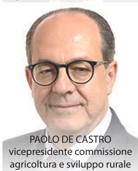
PAOLO DE CASTRO vicepresidente commissione agricoltura e sviluppo rurale